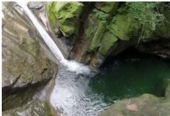
Scivolo e pozzo nella Valle di Corippo