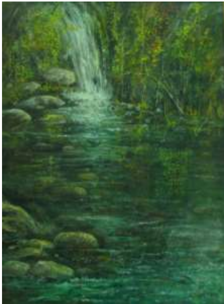
Cascata e pozzo (olio su tela)