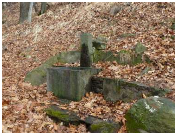
Fontana nel bosco a Sponda