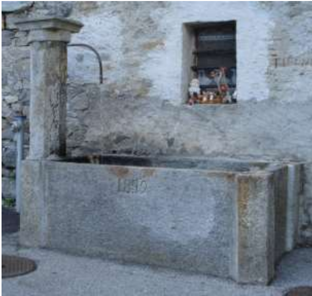
La fontana in piazza a Corippo

Chi per rivàa sù in paées a ghé da pasàa sora al pont che a ghé là indoa praticament u comincia el làagh artificial dela Verzasc'ca .