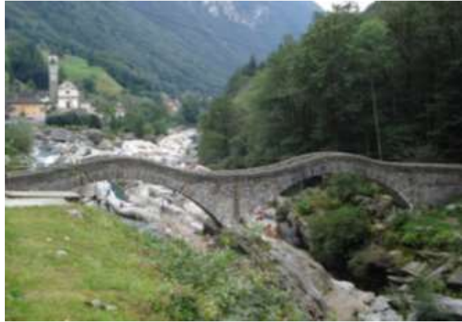
Il ponte di Lavertezzo

Ma Lavertezzo é famoso per uno dei ponti più belli che si possono vedere qui da noi. È stato costruito attorno al 1740 , demolito dalla buzza del 1868 e anche da quella del 1951 . Questo risulta essere uno dei luoghi più fotografati del mondo.