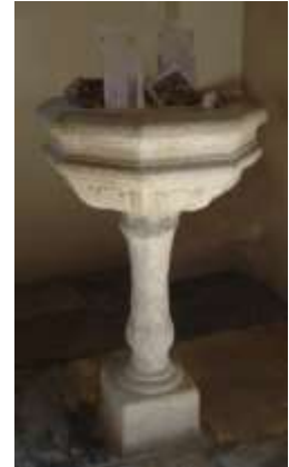
Le due acqua-santiere usate però per altri scopi