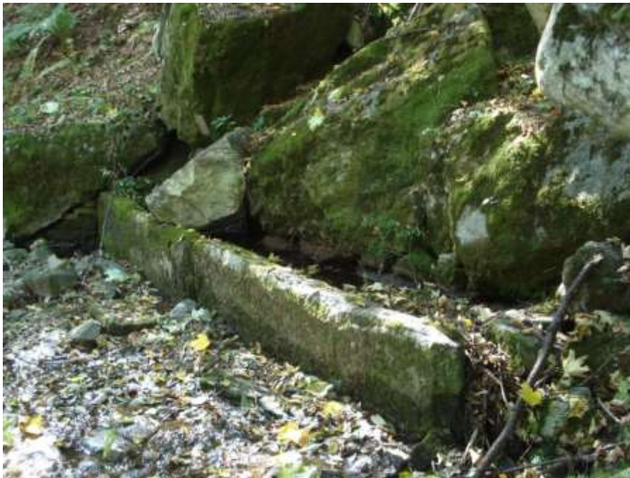
La vecchia fontana interrata e quasi abbandonata che si trova a lato del sentiero nel bosco in zona Cognora

Continuando sul sentiero dentro al bosco c'è una di quelle vecchie fontane interrata che erano destinate ad abbeverare le mucche quando salgono o quando tornano dall'alpe. Peccato però che qui da molto tempo più nessuno si é fermato a pulirla ... ed é un vero peccato ... perché é un buttare una cosa necessaria per tutti ..!