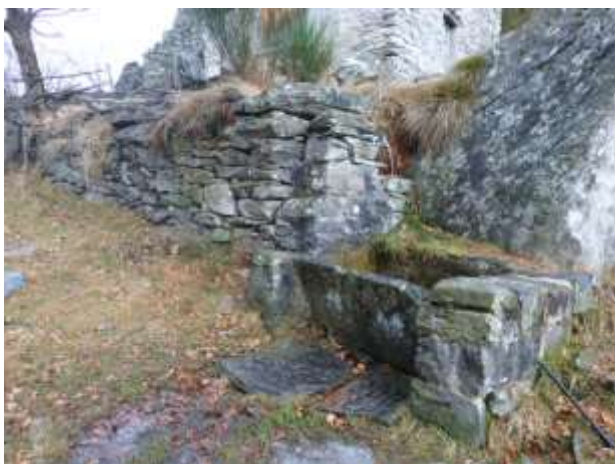
Fontana a Groppetto