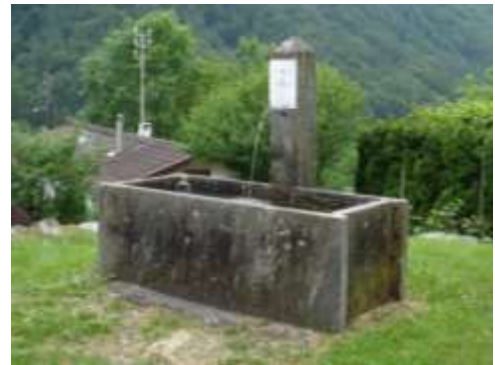
Fontana a Verzolo

Tornando indré da Rancoi a ghé la sc'trada che la va in sù in direzion da Sanbüghée indoa da fontan mi a no mia visc't . Da sicüür el fatto da véegh magari i cà visin a un riàa la fai si che l'acqua i nava driz li a tòla. La sc'trada pasando da Verzöö la va sù fin in Pian Vacaresc' indoa u partìs el sentéé che u porta sù per nàa in Val d'Agro e in Val Pincascia . Da chi a sa va sù ni mont, ni alp o sota ai scim come Cognora, Rodana, Rognoi, Caresc', Eos, Forn, Agro, Cremenzée, Cünésg', Lavazée, Cornavosa, Cort da Fond, Cort da scima, Fümegna e anca in altri sùid che ié da scià dal fiüm.