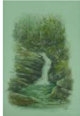
Il fiume Pincascia (acquarello)