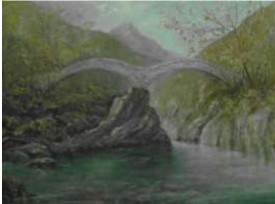
Il ponte (olio su tela)