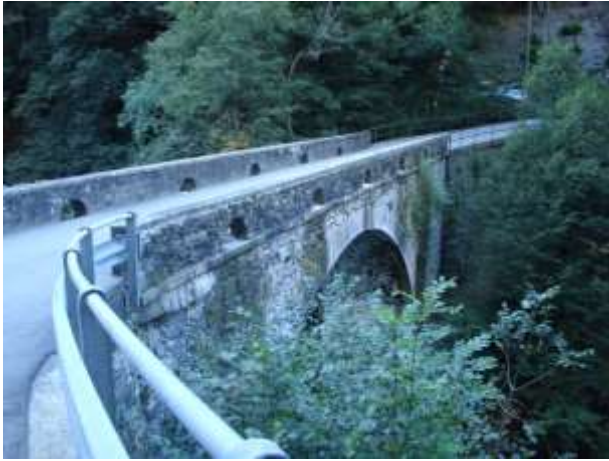
Il ponte sulla strada che porta a Corippo