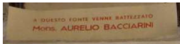
La scritta a conferma dell'avvenuto Battesimo