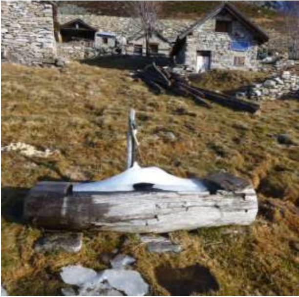
Fontana scavata in tronco di legno a Bardüghée