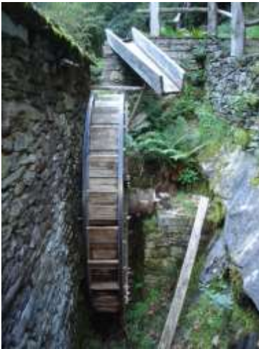
La vecchia ruota

Sotto al paese di Corippo dove si prende il sentiero che va a Mergoscia c'è il vecchio mulino. Quando si arriva in un luogo così bello come questo ti sembra di vivere dentro ad una cartolina.