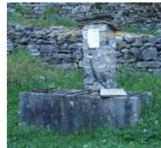
Le 4 fontane a Rancoi