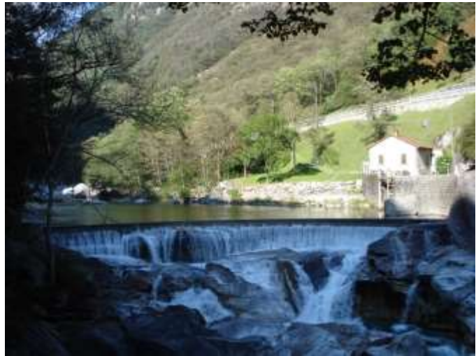
La "Chiusa di Corippo"

Sotto alla strada cantonale prima di arrivare a Lavertezzo c'è la " Chiusa di Corippo" . Qui c'è la presa d'acqua che serviva per la piccola vecchia centrale che c'è ancora a Tenero . L'acqua arriva laggiù tramite i tubi che fanno da condotta forzata (vedi pag.35-36)