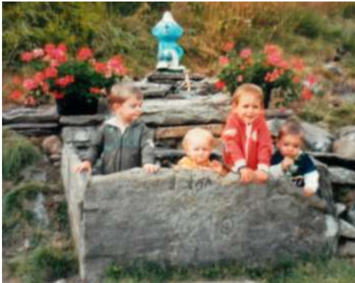
La bella fontana fiorita di Rienza