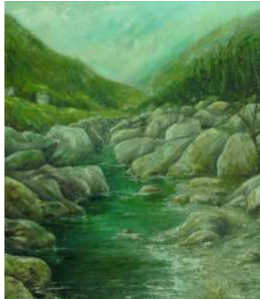
Il fiume (olio su tela)