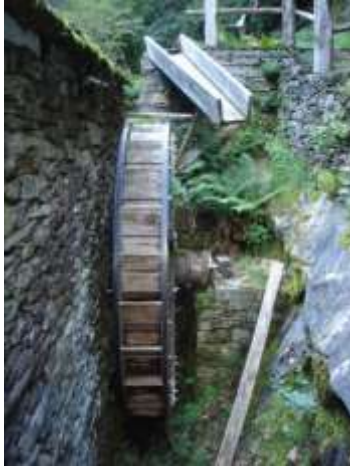
La ruota del vecchio Mulino nella Valle di Corippo