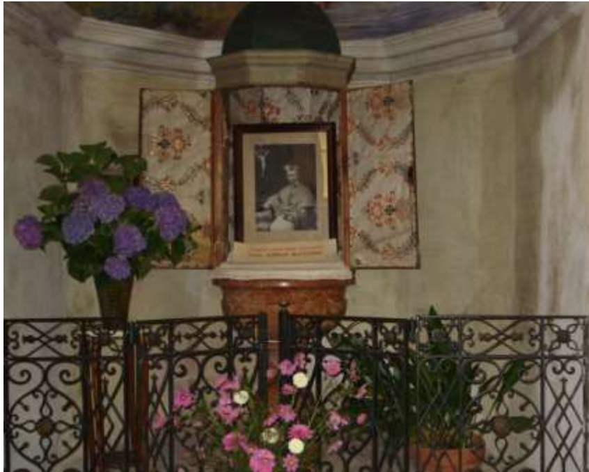
La Fonte Battesimale in marmo rosso nella Chiesa di Lavertezzo dove fu battezzato il Venerabile Monsignor Vescovo Aurelio Bacciarini (1873 – 1935)

La Chiesa di Lavertezzo é dedicata a Santa Maria degli Angeli ed é stata costruita attorno al 1578 . In seguito sono state fatte diverse modifiche negli anni : 1707 1780 1845