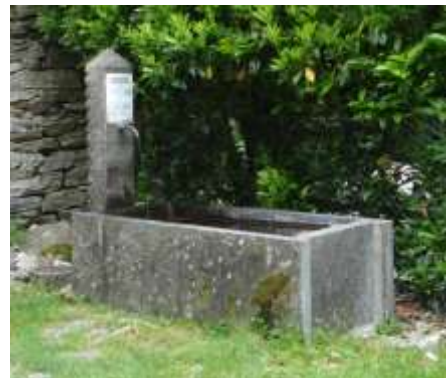
La fontana a Oviga di fuori