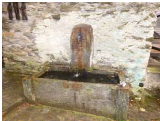
Le 2 fontane a Costa Piana Su quella di destra c'è la scritta 1893