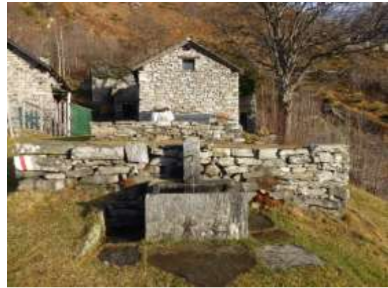
Le 2 fontane a Corte Nuovo