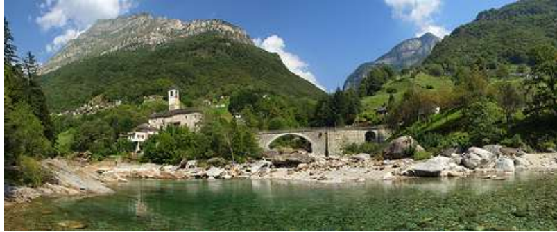
Il ponte sulla strada cantonale a Lavertezzo in una fotografia scattata dal di là del fiume

Attraversando il paese di Lavertezzo si passa sul ponte che scavalca la Valle Carecchio , la Pincascia e la Val d'Agro che poi si riuniscono in un solo fiume circa 1 km più in su.