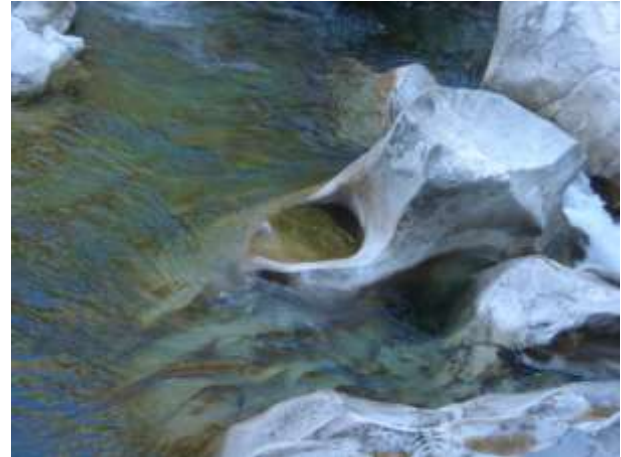
La forza dell'acqua che crea erosione nelle rocce sottostanti al lago artificiale alla Chiusa di Corippo