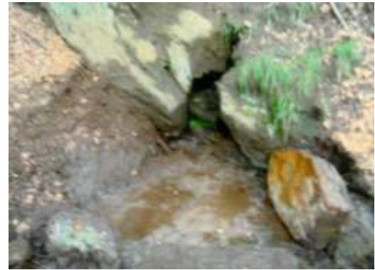
La vecchia fontana nel bosco sotto le case di Rienza

Sopra alla Valle della Porta , a 1391 m/s/m , c'è un altro di quei fantastici paradisi della Valle Verzasca ... è Rienza ... dove c'è un bel gruppetto di case ben sistemate e sempre frequentate da diversa gente. Qui, tra le case, c'è una fontana costruita nel 1910 e sempre tenuta in ordine e pulita. Qualcuno mantiene li ben messi dei vasi di geranio.