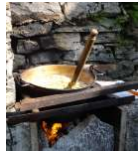
La polenta sul fuoco