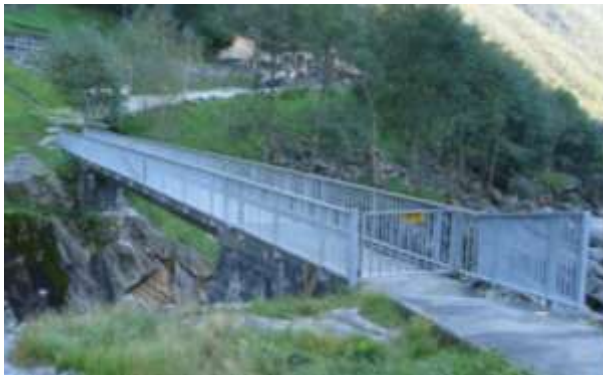
La passerella in zona Posse

A Lavertezzo ci sono altri ponti. Il primo é una passerella che dalle Posse porta al di là del fiume in zona Oviga di fuori passando sopra ad un grandissimo pozzo. E a Oviga c'è una fontana.