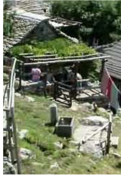
Fontana a Odro