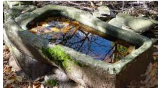
Le cinque fontane e il pozzo che si trovano in zona Revöira