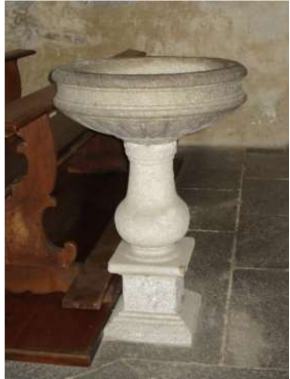
Una delle tre acqua-santiere