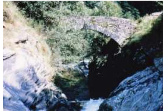
Ponte in Val d'Agro sul sentiero che porta a Forno