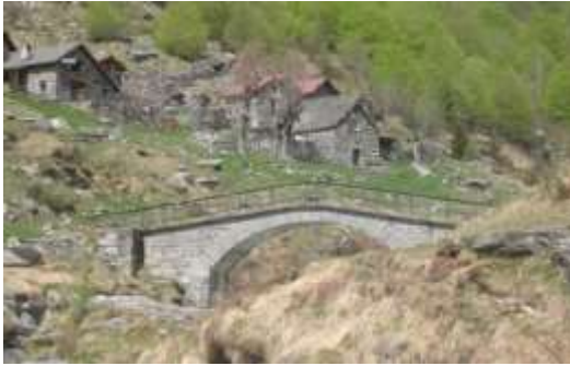
Ponte a Agro