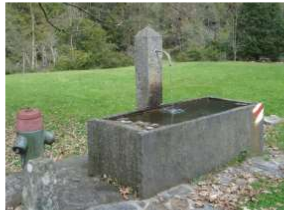
Fontana a Sgerbi