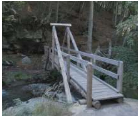
Ponte per Sambuco