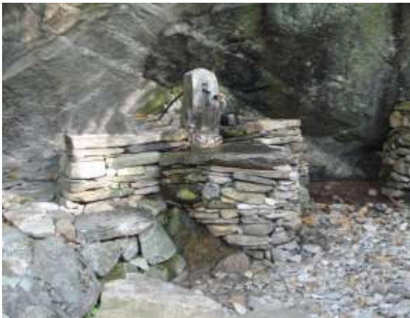
Fontana a Bisada