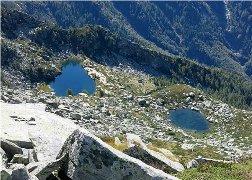
I due bellissimoi laghetti Pianca e Masnee in territorio Valmaggese (Fotografia trovata su una Rivista)

Dall'altra parte della Val d'Osola sul territorio che però fa parte della Valle Maggia messi li sotto le creste del Pizzo Costisc (2244 m/s/m) e della Cima Masnee (2203 m/s/m) ci sono due bellissimoi laghetti poco lontani l'uno dall'altro che sono quello della Pianca e quello del Masnee