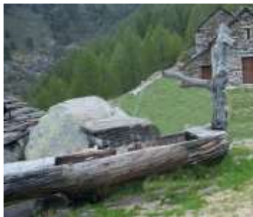
Fontana a Eos