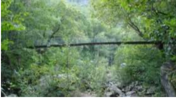
La vecchia passerella in zona alle Ganne