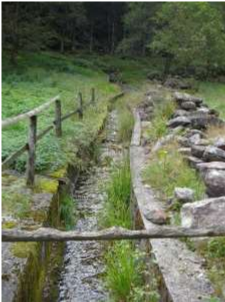
Riale incanalato a Posc'cùür