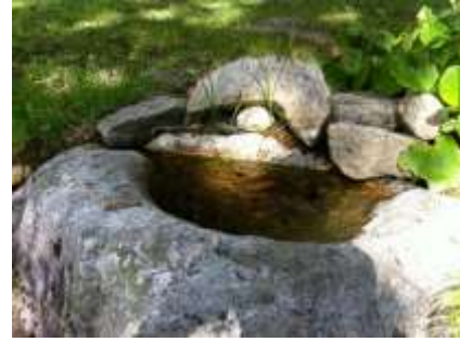
La piccola fontana opera di Ernesto Bisi

Da là dal fiüm praticament in faccia tra la Mota e el Ciozet ma sü sota ai cresc't dela Scima del Masnée (2203 m/s/m) a ghé el Laghet da Sc'tarlaresc' da Sgiof (1875 m/s/m) e un pò püsée in dent ma sota ai cresc't del Piz Costisc (2244 m/s/m) a ghé el Laghet da Sc'tarlaresc' da Scimarmota (1855 m/s/m). Sota da chi a ghé l' Alp da Sgiof (1728 m/s/m).