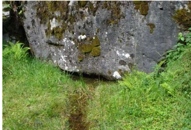
Le due vecchie fontane seminterrate al Bolastro