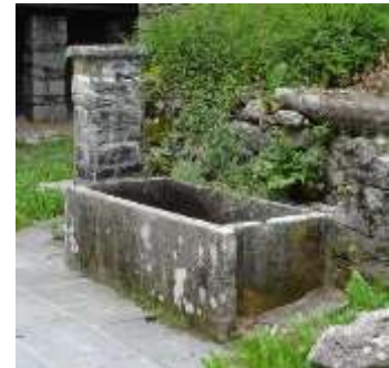
Le tre fontane nel nucleo alla Motta

In zona Ala Mota a ghé anca una paserela pitosc't vegia che la traversa el fiüm e la ma porta sota montagna, la indoa a ghé un grüpet da cà pitosc't sc'pandüüt.