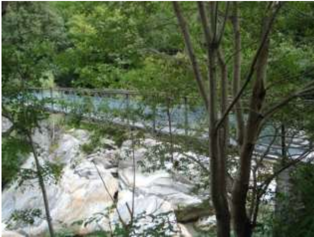
Passerella in zona Ai Piée

Quando si arriva in zona Ai Piée c'è un ponticello appeso alle rocce che mi porta di là dal fiume dove sale il sentiero del Gannone . Da lì il sentiero continua e va in direzione di Sonogno passando da Alnasca (Brione V.) , dal Lorentino e dalla Croce (Gerra V.) fino al ponte di Frasco e sempre dalla parte di là del fiume.