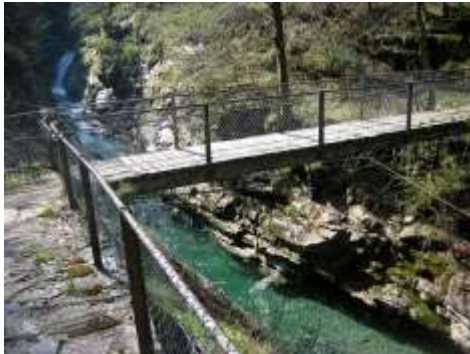
Ponticello e pozzo in Valle Carecchio