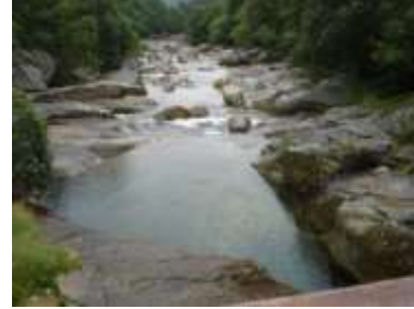
Il ponte e il sottostante pozzo al Bolastro

La Val d'Osola , benché sciora d'acqua, l'è pitosc't avara da fontan. Difati, almeno visin ala sc'trada, a ga né quasi mia. Vün di prim tûbi che porta acqua e che u podresa ves anca a disc'posizion da chi che i pasa a pé l'é a cà mea, al Bolasc'tro , ma l'é dent quasi nasc'condüüd in un riàa süc', pitosc't dificil da vedée. Un quai dì a dovrò decidom da tiral püsée in avanti, visin ala sc'trada e a portada da man da chi che i vöör rinfres'cas un atim. Ma se a pasée da li e a ghìi séet fermives a cà mea ... se mi a ga som e a trovii mia l'acqua ... a ga sarà un bicéer da chel bon !