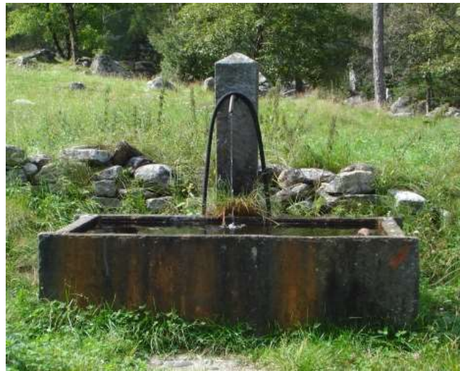
Fontana a Posc'cùür