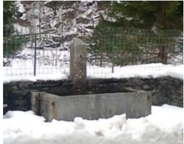
Fontana in zona Ai Piée

Da scia e sempro in zona Ai Piée da part ala sc'trada a ghé una bela fontana.