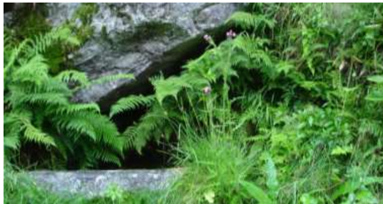
Fontana sotto terra al Bolastro in Val d'Osola territorio di Brione Verzasca