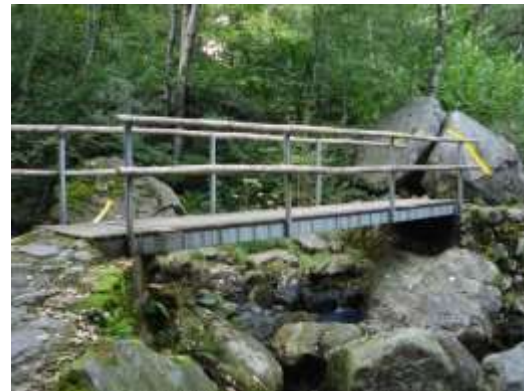
I due ponticelli sul sentiero per la zona Ganne