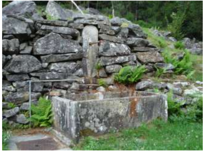
Le due fontane tra le case al Pianasc Su quella raffigurata a destra vi é la scritta B R 1805