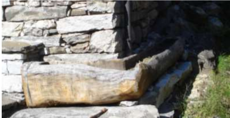
Lavandino in pietra e vasche in legno a Cognora