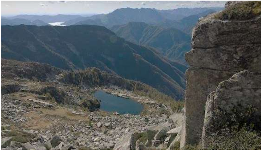
Il laghetto di Scimarmota