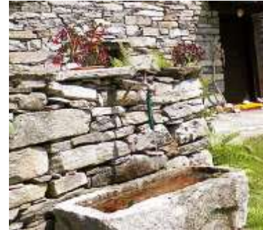
Lavandino in pietra al Monte Pincascia