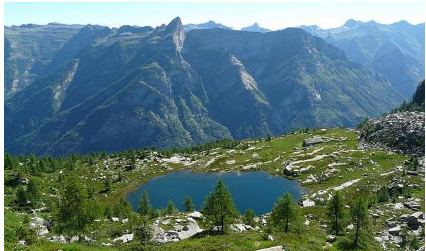
Il lago Starlarescio di Sgiof

Da là dal fiüm praticament in faccia tra la Mota e el Ciozet ma sü sota ai cresc't dela Scima del Masnée (2203 m/s/m) a ghé el Laghet da Sc'tarlaresc' da Sgiof (1875 m/s/m) e un pò püsée in dent ma sota ai cresc't del Piz Costisc (2244 m/s/m) a ghé el Laghet da Sc'tarlaresc' da Scimarmota (1855 m/s/m). Sota da chi a ghé l' Alp da Sgiof (1728 m/s/m).