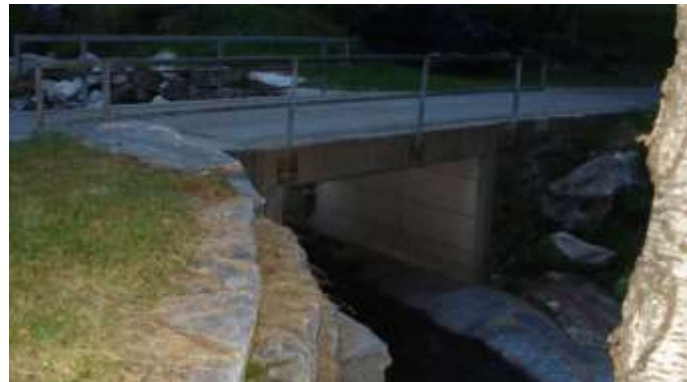
Il Riellöngh con il ponte tra Sprüghet e Bolastro