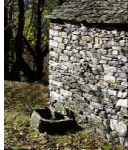
Le diverse fontane che si trovano in zona Ca d'dent

La fotografia in bianco e nero che rappresenta una doppia vasca in granito proviene dal volantino informativo "Revöira"