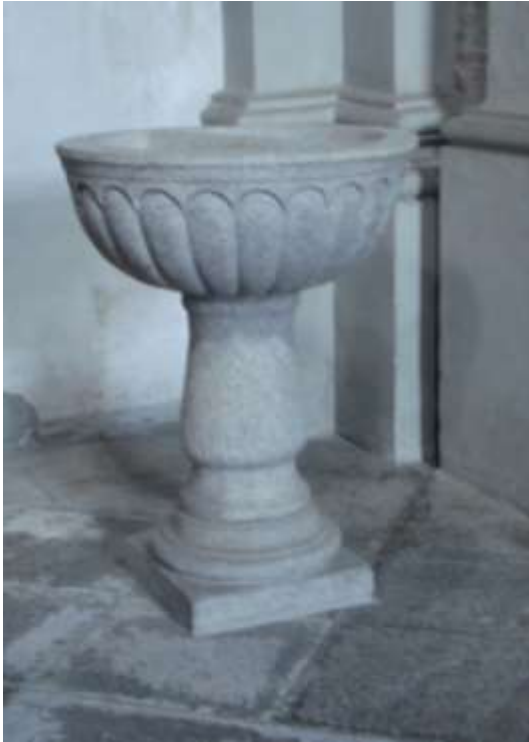
La Fonte Battesimale nella Chiesa di Brione Verzasca

La Chiesa di Brione Verzasca é dedicata a S.Maria Assunta ed é stata costruita nel 1296 . Nel 1541 é stato costruito e aggiunto il campanile. Poi é stata ingrandita tra la fine del 1600 e l'inizio del 1700 . Altri lavori sono stati fatti nel 1840 . Anche qui troviamo la Fonte Battesimale e tre acqua-santiere grandi posate una davanti ai banchi e le altre due in fondo alla Chiesa.