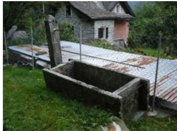
Vecchia fontana in disuso sul sentiero che dai Piéé porta a Pianasc