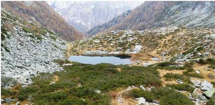
Il laghetto di Orgnana

Scendo dalle cime di Lavertezzo e riprendo la strada cantonale. In zona Aquino racchiusa in un muro c'è una bella fontana anche lei circondata di fiori. Sulla parete esterna davanti ci sono scolpite due iniziali e una data ( vedi sopra )