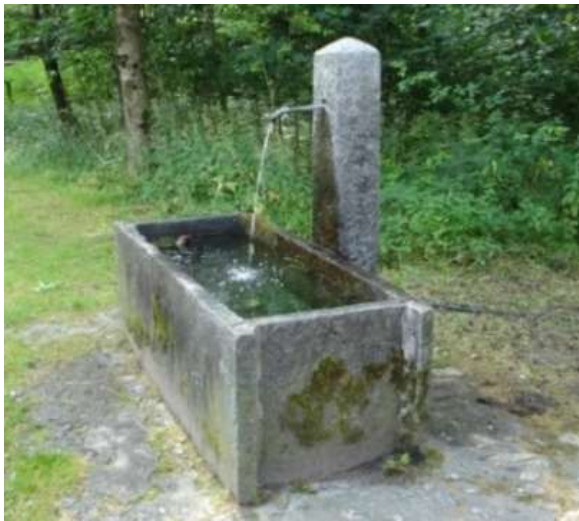
Fontana in zona alle Gerre/Perlo

Dopo la zona Ai Piée una stradina mi porta in direzione di Posc'cùür , di là dal Fiume Osola , dove ci sono diversi nuclei e piccoli monti come Alle Gerre/Perlo , Posc'cùür , Sgerbi e più sopra, partendo però dal sentiero che sale dalla zona Ai Piée si va in direzione dei diversi Valdi : quello dei Bisi , quello dei Marzorini , dei Togni e dei Bionda . Poi c'è Bisada , Pianesc , Secia , Sciüpada , Sparve e per ultimo proprio un luogo che si chiama Fontana . Sul mio cammino ho trovato diverse fontane che servono i diversi luoghi. Le vecchie fontane interrato però sono sparite e quindi non vi é più nulla con pure molti rustici abbandonati.