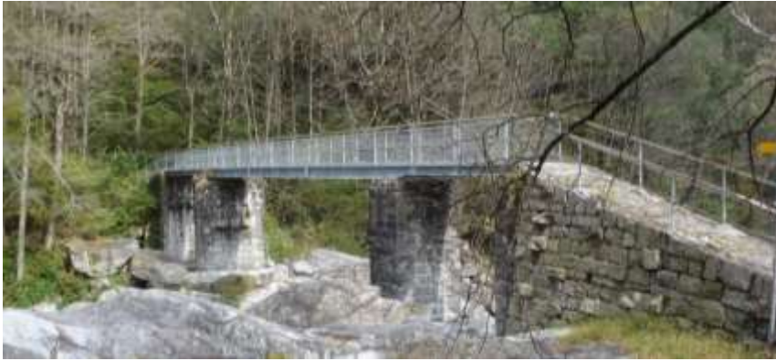
Il ponte sull'Osola a Posc'cùür