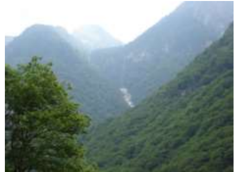
La Valle di Orgnana

Sül territori da Lavertez a ghé anca un belisim laghet da montagna. L'è el Laghet da Orgnana che l'è da là dal fiùm e l'è sù a 1872 m/s/m . Da chi la partis la Val d'Orgnana che la va pöö a bütas denta nela Val del Cansgel e che la riva giò tra Aquin e la Mota in territori da Briom Verzasc'ca .